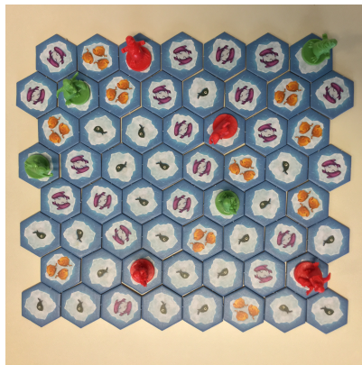
FIGURE 1 – Plateau du Jeu du Pingouin

Le jeu se termine lorsque aucun des pingouins ne peut se déplacer, et le joueur avec le plus de points remporte la partie.